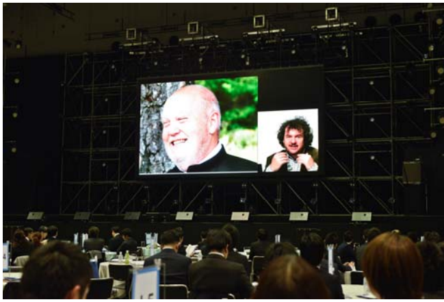
環境保護活動家 ニック・マークス氏による 特別講演(ロンドンから中継で講演)

全国各地において産業や観光・教育・少子化等の課題に正面から取り組み、目覚ましい成果を上げておられる方々による事例講演の様子。