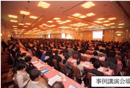
事例講演会場内の様子