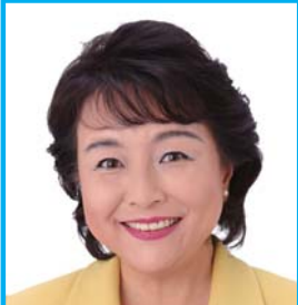
元内閣府特命担当大臣 (少子化、男女共同参画)

地方創生をテーマに豪華ゲストが講演！ ニック・マークス氏／猪口邦子氏／北橋健治氏